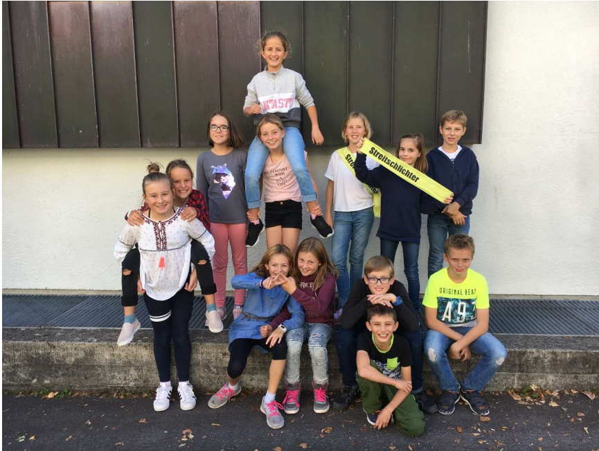
Die Starkmacher/innen im Schuljahr 2018/19: Von oben nach unten (und von links nach rechts):

Herzlichen Dank an unsere 13 Starkmacher/innen, die in diesem Schuljahr diese wertvolle Arbeit geleistet haben: