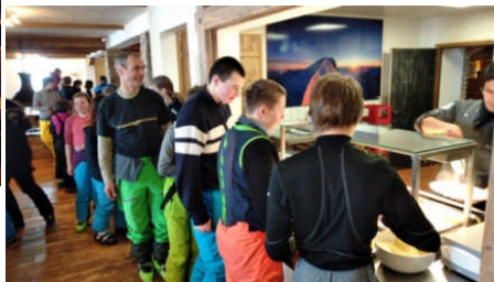
Tolle Disziplin bei der Essensausgabe