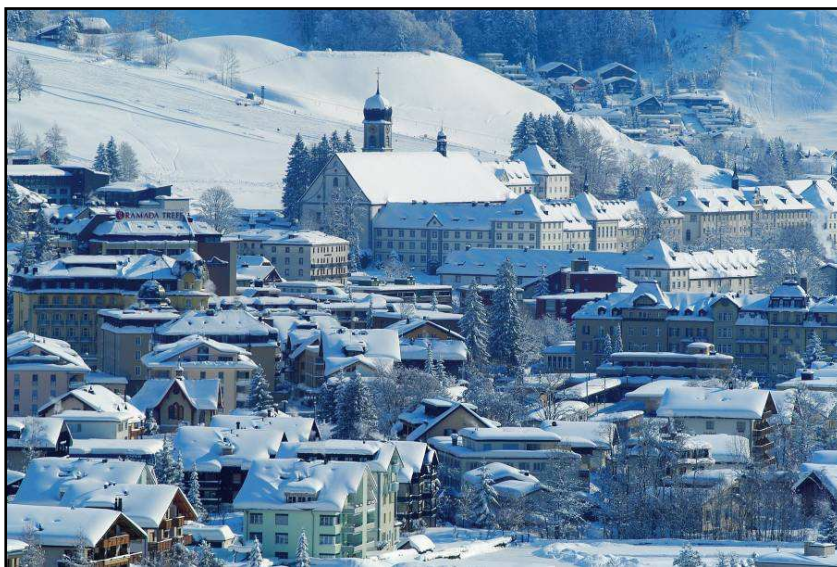
Engelberg entscheidet am 20. April, wer im Gemeinderat Einsitz nimmt.

Die provisorischen Wahlvorschläge für die Gesamterneuerungswahl des Einwohnergemeinderates Engelberg für die Amtsdauer 2008 bis 2012 wurden aufgrund der Ausführungsbestimmungen über die Gesamterneuerungswahlen der Gemeinderäte und Gerichte für die Amtsdauer 2008 bis 2012 vom 4. Dezember 2007 überprüft und konnten in Ordnung befunden werden. Als nächster rechtlicher Schritt war die Auslosung der Reihenfolge der Wahlvorschläge zu Händen des Wahlzettels vorzunehmen. Der Einwohnergemeinderat Engelberg hat die Auslosung an der Sitzung vom 12. März 2008 vorgenommen und bestätigt folgendes Resultat: