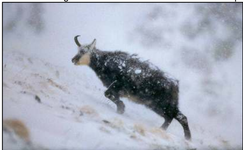
Eine Gämse kämpft sich im Schneesturm durch den Schnee.

Die Wildtiere reagieren empfindlich auf Störungen in ihrem Lebensraum. Oft verlassen sie ihren Lebensraum in wilder Flucht. Der dabei entstehende grosse Energieverlust kann zu Schwächeanfällen und bis zum Tode der Wildtiere führen. Regelmässig wiederkehrende Störungen während des Winters beeinflussen zudem nachweislich die Populationsdynamik der Wildtiere negativ. Aufgrund dieser Umstände wurden nun neben Engelberg auch auf Melchsee-Frutt Schutzzone geschaffen. Damit können übermässige Störungen in den empfindlichen Wildtier-Lebensräumen ab sofort verhindert und auch strafrechtlich geahndet werden. Die offiziellen Ski- und Snowboardrouten sind gemäss der Skitourenkarte von swisstopo und der eigens für Engelberg ausgearbeiteten Karte „Wald-Wild-Schutzzone“ ausgenommen. Die Schutzmassnahmen gelten ausschliesslich für die Wintersaison. Das heisst: jeweils vom 15. November (respektive dem Vorliegen einer geschlossenen Schneedecke) bis zum 15. Mai.