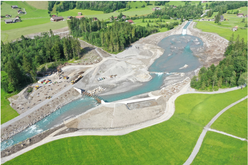
Abbildung 1: Blick auf den Geschiebe- und Holzrückhalteraum Bannwald (Mitte Juli 2021)

Die Bauarbeiten am Hochwasserschutzprojekt Engelberger Aa verlaufen weiterhin planmässig. Seit dem letzten Zwischenbericht hat der Geschiebe- und Holzablageungsraum im Bannwald immer mehr seine Endform angenommen. Im Weiteren wurden entlang dem Bachlauf Endgestaltungsarbeiten realisiert, so dass der neue Wander- und Fussweg entlang der Engelberger Aa zwischen der Sodbrücke und Lauibrücke auf der ganzen Länge wieder geöffnet ist.