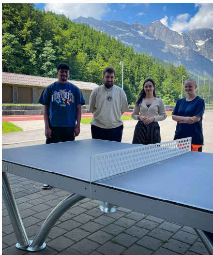
Standort Ping Pong-Tisch: