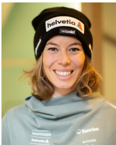
Michelle Gisin (Jg. 1993, Nationalmannschaft, Ski Alpin)

Ab 11.00 Uhr spielt die Musikgesellschaft Engelberg das traditionelle 1. August-Konzert. Bei schlechtem Wetter finden die Veranstaltungen im Kursaal Engelberg statt.